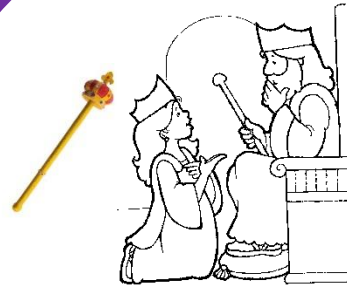
Ester spreekt met de koning